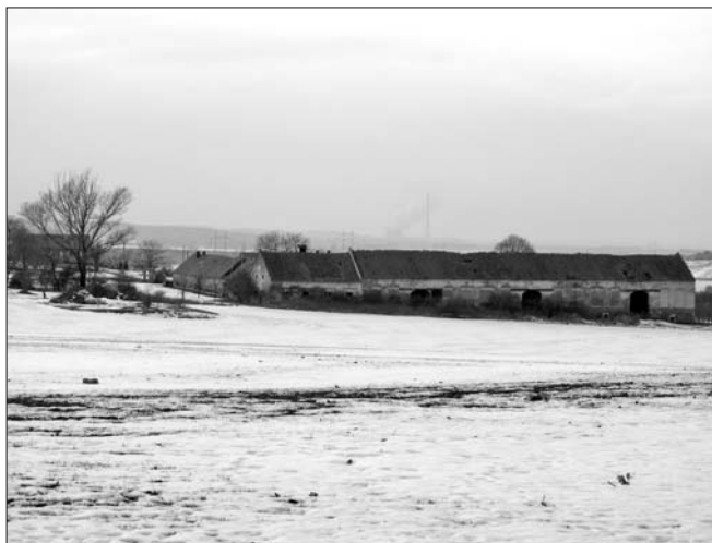
Horecký dvůr v současné době.