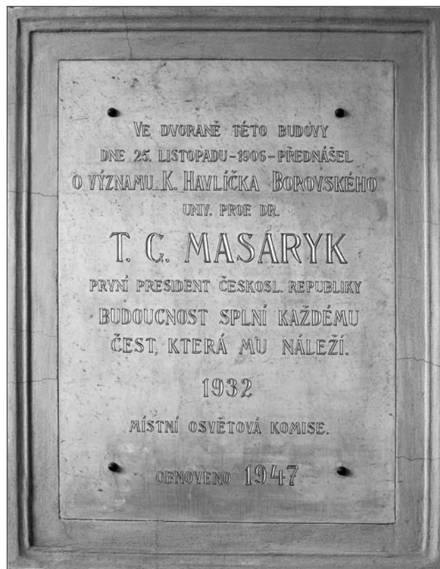
Deska v budově Záložny připomíná dodnes Masarykovu přednášku roku 1906

Na rok výročí Havlíčkova úmrtí připravil Masaryk přednáškové turné. Čas o ní 15. 8. roku 1906 referoval: Profesor Masaryk je „úplně zaneprázdněn přednáškovou akcí o Havlíčkovi, kterou koná s neobyčejným nadšením a s vlastní jemu opravdovostí po městech na obou stranách česko-moravského pomezí...“ Přednášky byly přitom pojaty typicky masarykovsky – nejednalo se o povrchní glorifikaci národního hrdiny nebo jen sentimentální vzpomínku. Byly především důkazem toho, že i na počátku 20. století je Havlíček inspirativní osobností.