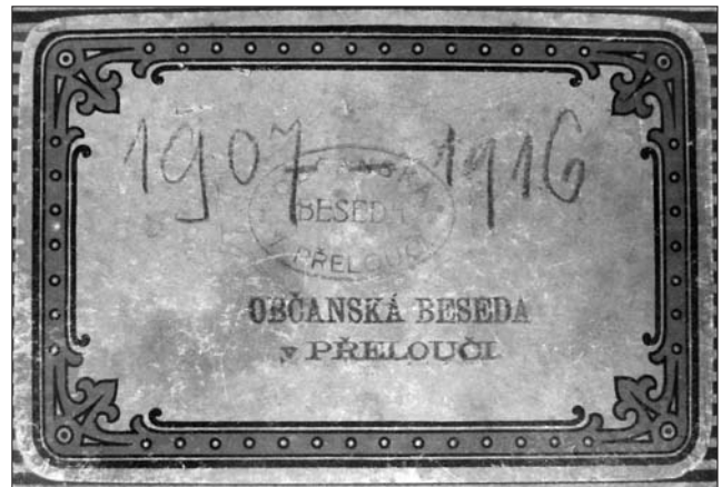
Detail desek protokolní knihy Občanské besedy. V jednatelské zprávě z 25. 4. roku 1907 se nachází některé cenné informace o přednášce T. G. Masaryka na podzim roku 1906